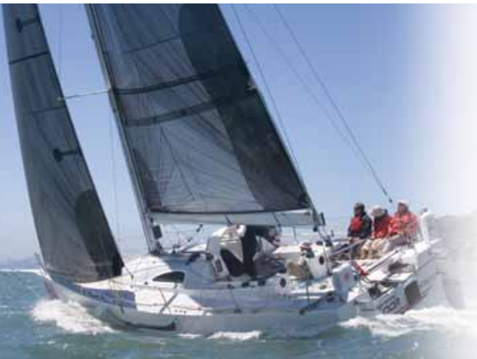
California Condor, Antrim 40, Antrim Associates, Berkeley Marine Center