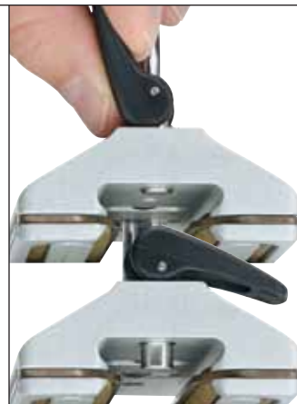
Wózek zaopatrzony w bolce blokujący umożliwia ruch lub zablokowanie na pozycji.

*Aby zamówić szyny anodowane na czarno metodą Hardkote usunąć „CLEAR” z końca nazwy katalogowej.