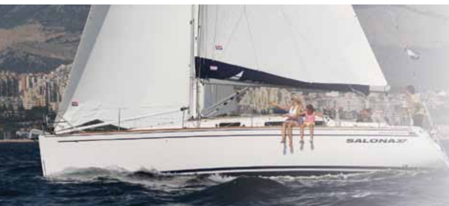
Salona 37, J & J Design, AD Boats