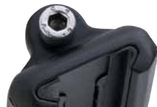
Plastyczny element ślizgowy

Wózki posiadają wytrzymałe łożyska z kulkami z materiału Torlon®. Stalowa prowadnica utrzymuje kulki na miejscu, kiedy wózek jest zdjęty z szyny.