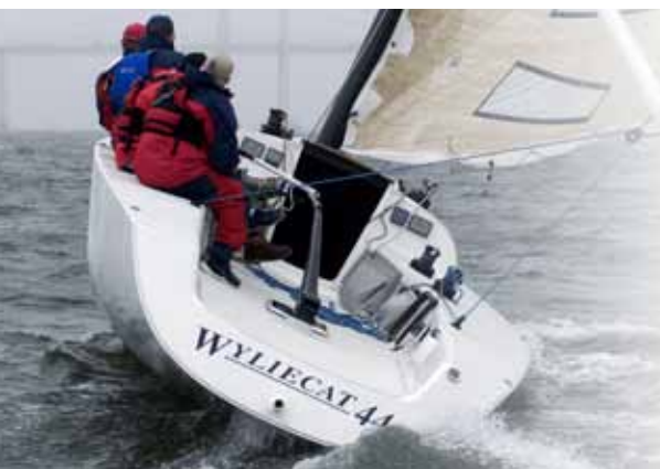
Wylecata 44