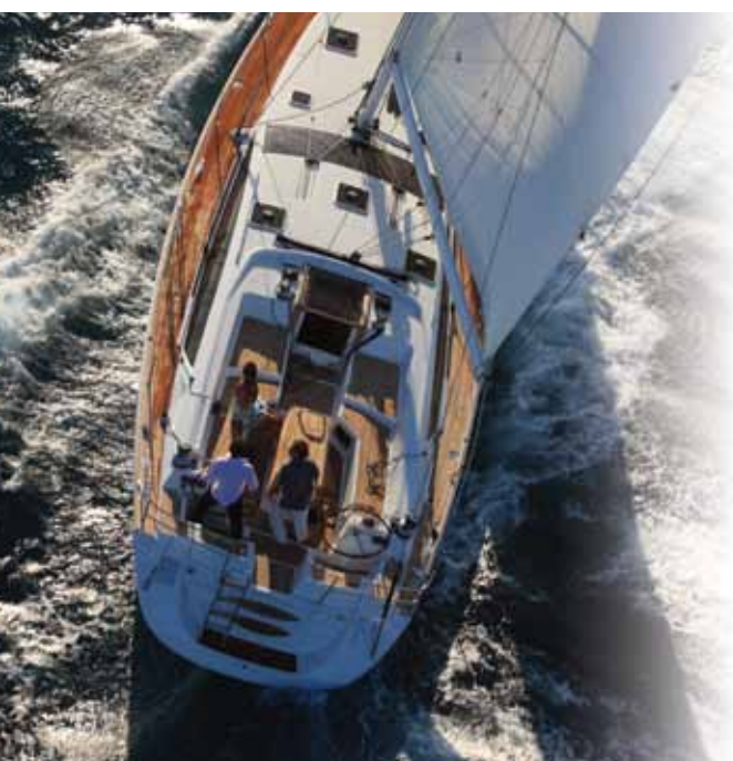
Jeanneau 53, Philippe Briand Yacht Design, Garroni Premorel, Jeanneau Yachts

Napięcie akumulatora oraz rozmiar kabestanu determinują jakiego sterownika, wyłącznika awaryjnego oraz kontrolera obciążenia użyć. Dla kabestanów serii 1110 i większych, skontaktuj się z Harkenem aby dobrać elementy.