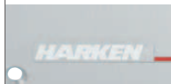
Aluminium bezbarwnie anodowane