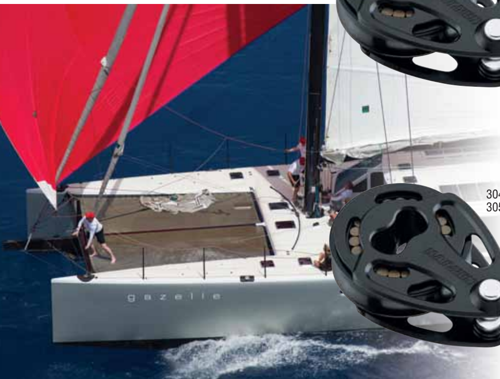
Gazelle, Gunboat 66, Morrelli and Melvin, Gunboat (Pty) Ltd.