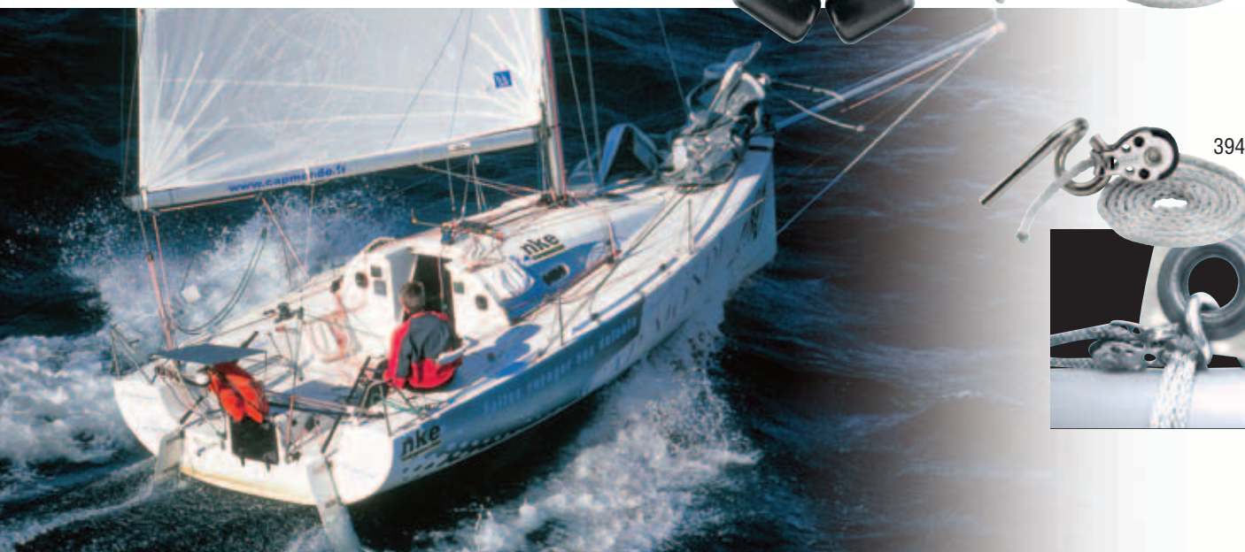
Pogo 2, Mini TransAt, Finot-Conq Architect Group, Open Sailing, Inc.